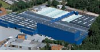
Hörmann KG Amshausen