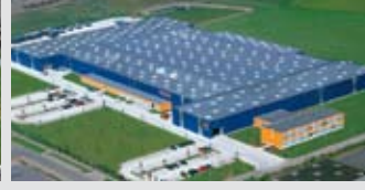
Hörmann KG Brandis