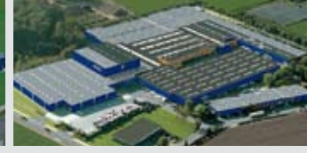
Hörmann KG Brockhagen