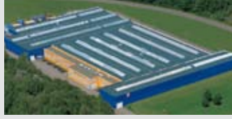
Hörmann KG Eckelhausen