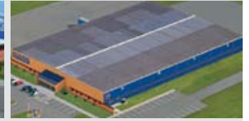
Hörmann Inc. Vonore TN, ABD

Hörmann, uluslararası pazarda, bütün önemli yapı elemanlarını kendisi üreten tek firmadır. Bu yapı elemanları en çağdaş teknolojilerin uygulandığı fabrikalarda üretilmektedir. Avrupa pazarının bütününü kapsayan satış ve servis ağı ve Amerika ve Çin pazarlarındaki varlığı sayesinde Hörmann yüksek kaliteli yapı elemanları için uluslararası arenada güçlü bir ortağınızdır. Ödün vermeyen kalitesi ile birlikte.