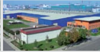
Hörmann Beijing, Çin