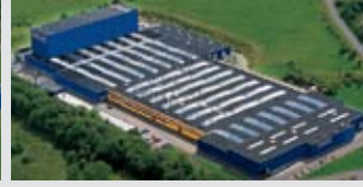
Hörmann KG Freisen