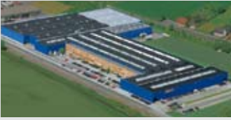
Hörmann KG Werne