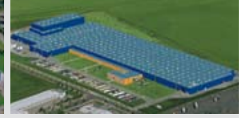
Hörmann KG Ichtshausen