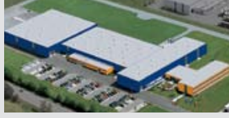
Hörmann KG Motor Fabrikası