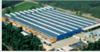
Hörmann Genk NV, Belçika