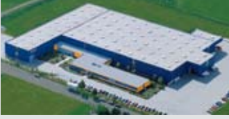
Hörmann KG Dissen